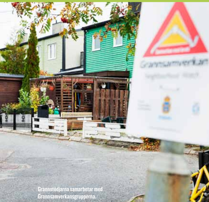
Grannstödjarna samarbetar med Grannsamverkansgrupperna.