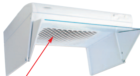
Filter av plast- eller metalltyp ska rengöras.