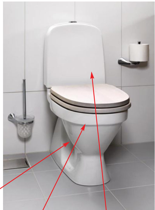
Rengör spolkanterna (på insidan) med toalettreningsmedel.

Rengör så långt in i kröken som möjligt.